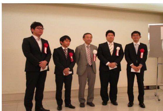
支部長賞受賞者 4 名

また中部支部長賞は、昨年 9 月に愛媛大学で開催された全国大会発表奨励賞受賞者で中部支部の会員の方々を『中部支部長賞』として表彰している。以下表彰された 4 名を紹介する。