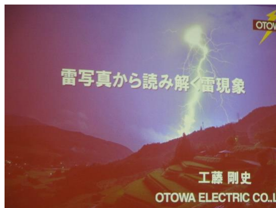
講演タイトルスライド